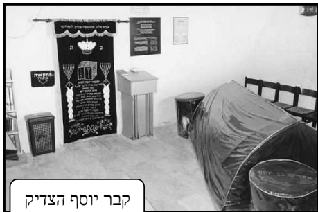
קבר יוסף הצדיק

"...על ידי כח ארונו של יוסף הצדיק שהוא בחינת קבר הצדיק, על ידי זה היתה עיקר הגאולה..." "...קליפת עמלק הוא אורב תמיד על כל אחד מישראל בכל עת שרוצה להתקרב אל הקדושה והוא מתגבר בכל פעם מחדש..." "...כשרוצים לבוא לארץ ישראל (שהוא כלליות כל הקדושות), מתגברים ומשתטחים המניעות והעיכובים מאוד מאוד, שאי אפשר להכניעם כי אם על ידי כח קברי הצדיקים..." "...עיקר מפלת קליפת עמלק לגמרי יהיה רק כשיבואו ישראל אל המנוחה ואל הנחלה, וכפרט על ידי צדיקים שוכני עפר שכבר באו אל המנוחה בשלימות..."